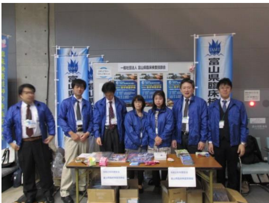
富山県臨床検査技師会ブース