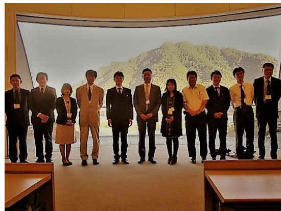
岐阜城をバックに参加者全員で